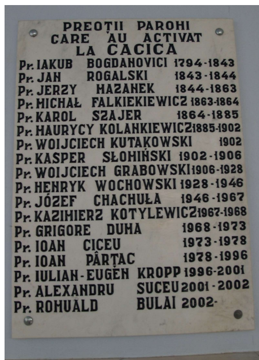
Tablica z nazwiskami polskich duchownych – proboszczów parafii w Kaczyce