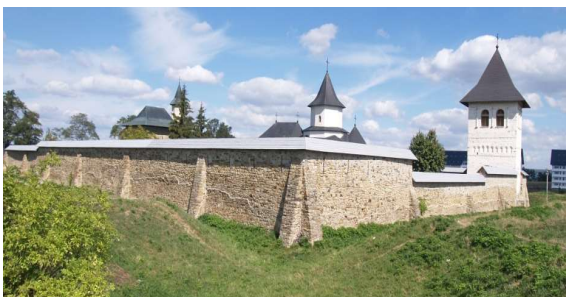
Monastyr Zamca (Suczawa) – miejsce stacjonowania Jana III Sobieskiego

pochodzić od polskiego słowa „zamek”. Warto dodać, że Sobieski zamierzał usadowić na tronie Mołdawskim swojego syna Jakuba. Wojska polskie pozostawały w tym monasterze przez kilka lat.