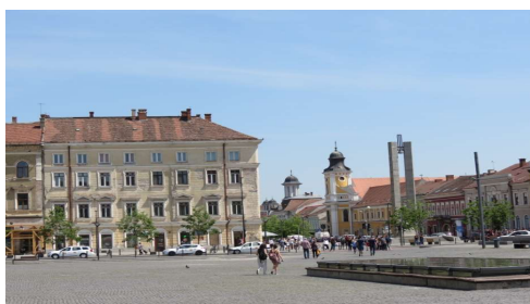
Dom w Cluj-Napoca gdzie mieszkał Józef Bem

Pozostańmy jeszcze w Siedmiogrodzie. Tu, jedną z kluczowych postaci polskich związanych z tym regionem jest z pewnością generał Józef Bem . Ten polski generał urodził się 14 marca 1794 r. w Tarnowie (podaje się również jako miejsce urodzenia Busko pod Tarnowem). W czasie powstania listopadowego był dowódcą artylerii. Potem aktywnym działaczem Wielkiej Emigracji. Między innymi założył dwie organizacje. Pierwszą z nich było Towarzystwo Historyczno-Literackie a drugą Towarzystwo Politechniczne Polskie z siedzibą w Paryżu. Brał udział w Wiośnie Ludów, a w latach 1848-1849 był naczelnym wodzem powstania węgierskiego. W czasie walk przeciwko Austriakom zdobył między innymi Sybin i Braszów. Wkroczył również na Bukowinę. Potem stał się wysokim dowódcą wojsk osmańskich. Zmarł 10 grudnia 1850 r. w Aleppo (obecnie Syria). Na jednej z kamienic w Cluj-Napoca (tzw. Klużu) znajduje się tablica informująca o pobycie w niej generała Józefa Bema.