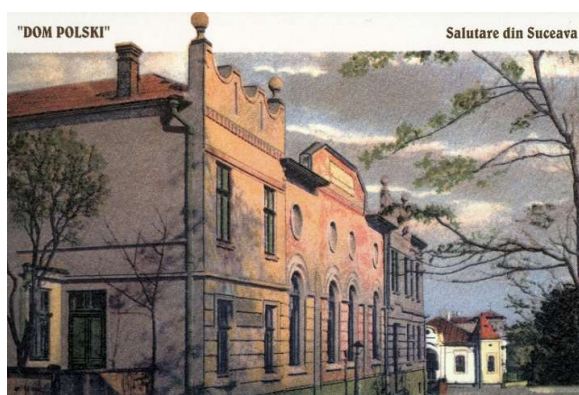
Dom Polski w Suczawie