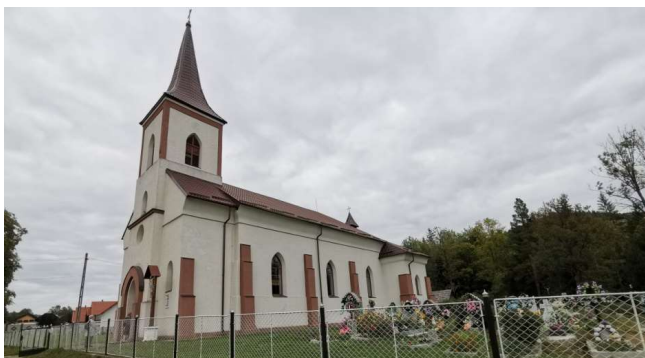
Kościół w Pojanie Micului