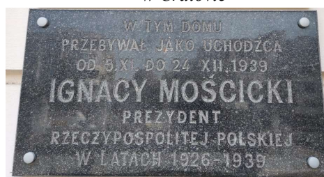
Tablica upamiętniająca internowanie Prezydenta Mościckiego w Craiovie

Na terenie Rumunii zatrzymany został również prezydent Ignacy Mościcki . Miejsca, w których był internowany to między innymi Bicz oraz Craiova. Udało mu się jednakże wyjechać do Szwajcarii. Było to już 25 grudnia 1939 r. Inni spróbowali uciec i to z pozytywnym skutkiem. Tak było w przypadku Edwarda Śmigłego Rydza, Felicjana Sławoja Składkowskiego, Witolda Grabowskiego, Mariana Zyndrama-Kościałkowskiego, Juliusza Poniatowskiego czy Mchała Grażyńskiego.