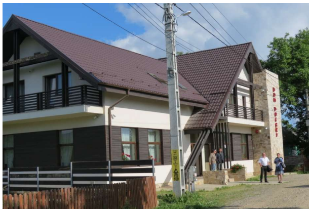
Dom Polski na Pleszy

Okres I wojny światowej nie był tragiczny w dziejach wioski w przeciwieństwie do działań wojennych w latach 1940-1944. W 1943 r. Pleszanie byli werbowani do armii rumuńskiej, choć trudno określić ilu mężczyzn wcielono wojska. Trafili oni do 14 dywizji, która przez Odessę została przewieziona pod Stalingrad i tam walczyła przy boku Niemiec z sowietami. W roku 1944 Plesza znalazła się na linii frontu pomiędzy wycofującymi się Niemcami, a nacierającą armią czerwoną. Mieszkańcy ukrywali się w lasach, a nocą wracali do domów, żeby zabrać co cenniejsze rzeczy.