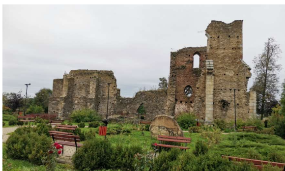
Ruiny katedry katolickiej w Baia

Śladów Polaków na ziemiach obecnej Rumunii można doszukiwać się już w okresie średniowiecznym. Za pierwszą ze znanych Polek, można uznać księżniczkę Małgorzatę , która była żoną hospodara mołdawskiego Aleksandra Dobrego. Ożenił się on z nią około roku 1393 lub 1394. Ponieważ była wyznania rzymskokatolickiego ufundował dla niej katedrę w Baia, która była pierwszą stolicą Mołdawii. Świątynia ta nosiła wezwanie św. Dziewicy i była największym kościołem rzymskokatolickimi na terenie Mołdawii. Jeden z architektów miał twierdzić, że była gestem dyplomatycznym wobec silnych, ale zarazem agresywnych sąsiadów, jakimi mieli być w tym czasie Polacy.