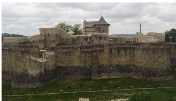
Twierdza w Suczawie, którą próbował zdobyć Jan I Olbracht

Niestety oblężenie Suczawy nie powiodło się, a wyprawa 40 tysięcznej armii pospolitego ruszenia zakończyła się wielkimi stratami polskich wojsk w bitwie pod Koźminem . Straty były tak dotkliwe, że od tego czasu klęskę tę na wieki utrwaliło mocno przesadzone powiedzenie: Za króla Olbrachta wyginęła szlachta .